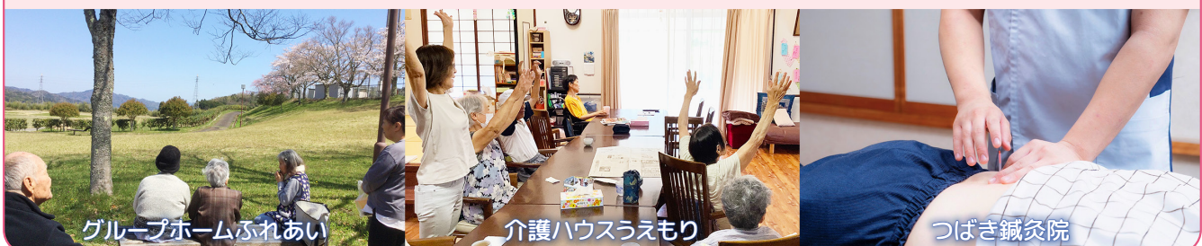
グループホームふれあい

2013年12月には「認知症なんでも相談カフェうえもり」を開設。認知症の状態にある方を支える、さまざまな方々の相談役として、これまでに延べ約280件にのぼるご相談に対応させていただきました。